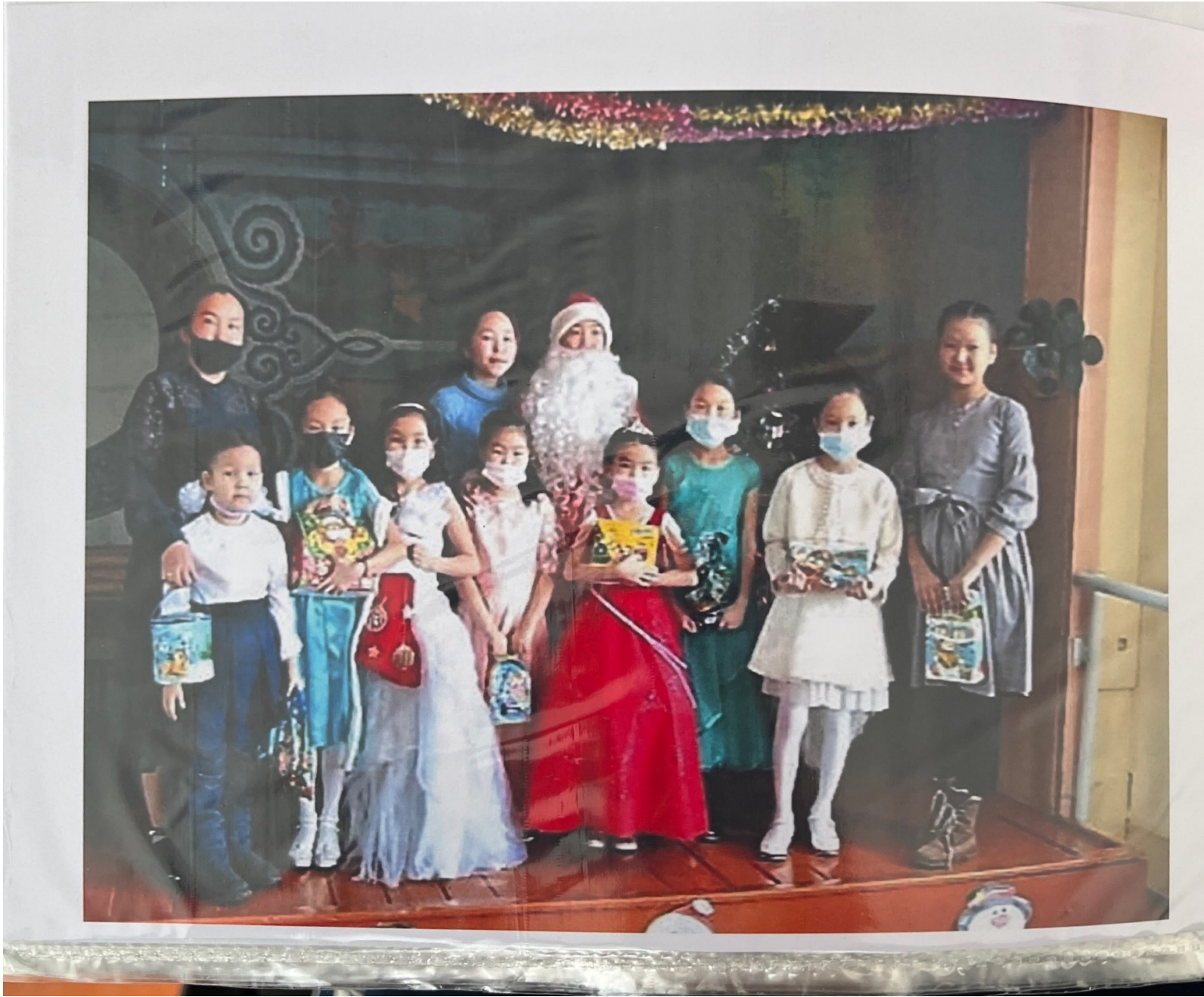
Scanned with CamScanner